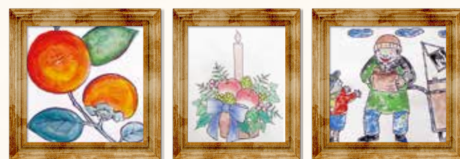
ミック登美ヶ丘ご利用者様の作品

ぬり絵は自分に合った難易度・ジャンルの絵柄を選びましょう。合っていないと、ぬり絵が苦になったり、つまらないものになってしまいます。脳全体を活性化させるために大切なのは、夢中になって楽しむこと。ぬり絵で豊かなリラックス時間を過ごしてみませんか。