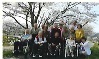
桜の下で笑顔がこぼれます