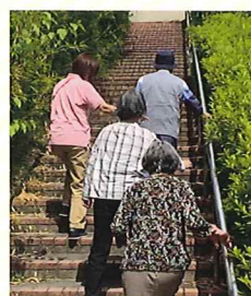
高山竹林園内での散策