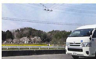
車窓から見事な景色が見えてきました

大御堂観音寺の菜の花畑、けいはんな公園、秋篠川の桜など 3~4月の“あい”は、ミックおすすめ お花見スポットへのドライブを多数ご用意しています。 寒さの残る季節ですが、春の空気と一面の菜の花畑や桜並木を眺めて感じて、冬から春への季節の変化を楽しみましょう!