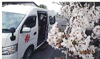
桜満開のお花見日和