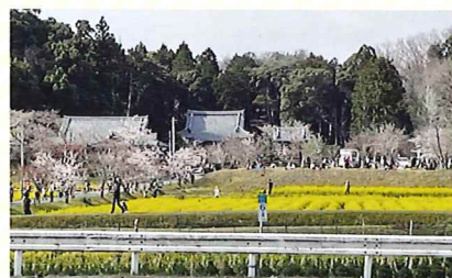
大御堂観音寺(京田辺)