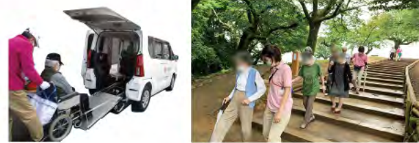
皆さん大好き♡外出レク