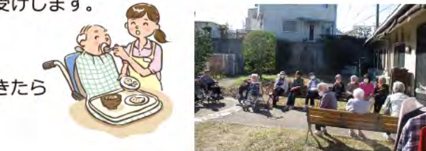
ミックガーデンで憩いのひと時