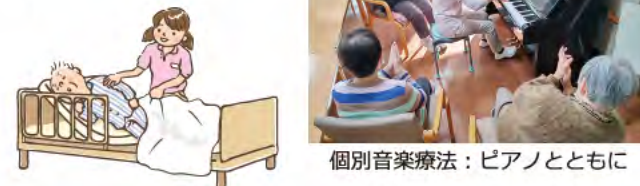
個別音楽療法：ピアノとともに