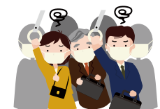
混雑した乗り物の中