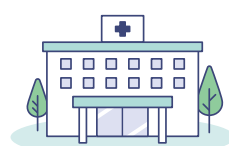
医療機関に行くとき