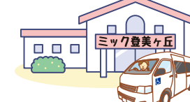
高齢者施設など訪問するとき