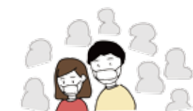
混雑した場所に行くとき